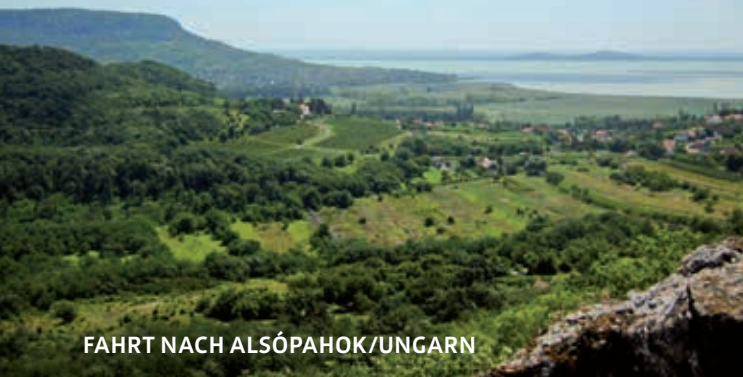
FAHRT NACH ALSÓPAHOK/UNGARN