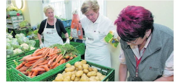
Mitarbeiterinnen der Nürnberger Tafel